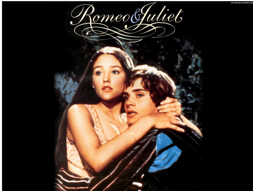
Figure 1: Film Romeo and Juliet (1968)